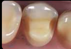
Finition et polissage de la préparation