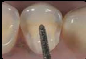
Réduction occlusale de la cuspide palatine

Preparazione cavitaria, solchi occlusali di orientamento