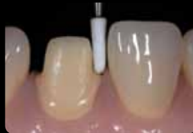
Finition et polissage de la préparation

Rifinitura e levigatura della preparazione