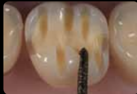
Rainures d'orientation occlusales