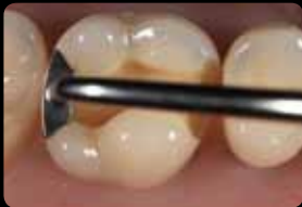
Préparation de la boîte proximale

Preparazione dell'incassettatura prossimale