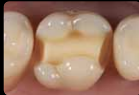
Préparation après finition et polissage

Levigatura della cavità e box prossimale