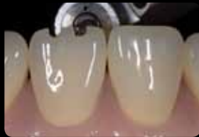
Rainures d'orientation incisales