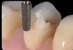
Création d'un épaulement circulaire

Riduzione occlusale e palatale della cuspide