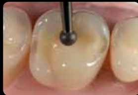
Rainure d'orientation dans le sillon médian