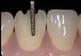
Préparation vestibulaire impliquant 3 niveaux ; concavité palatine

Preparazione vestibolare a 3 livelli: concavità palatale