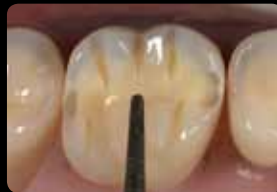
Rainures d'orientation sur les cuspides