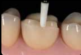
Finition de la préparation