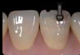
Rainures d'orientation centrales et incisales

Solchi mediani ed incisali di orientamento