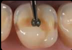
Ouverture du sillon médian