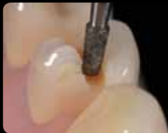
Préparation de la cavité, Rainures d'orientation occlusales

Preparazione cavitaria, solchi occlusali di orientamento