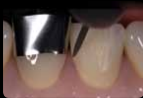
Séparation proximale initiale