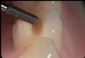
Polissage de la cuspide