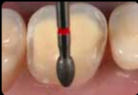
Création d'un épaulement circulaire

Realizzazione del bordo circolare della preparazione