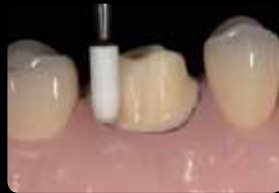
Finition et polissage de la préparation

Rifinitura e levigatura della preparazione