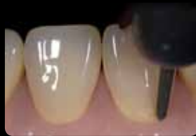
Rainures d'orientation cervicales