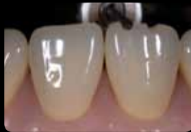
Rainures d'orientation incisales