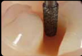
Préparation de la cavité