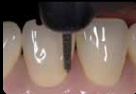
Faces vestibulaire et palatine : Rainures d'orientation cervicales

Vestibolare e palatale: solco marginale di orientamento