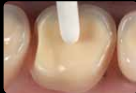
Polissage de la préparation