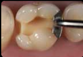
Préparation de la boîte proximale

Preparazione dell'incassettatura prossimale