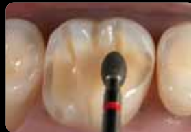
Réduction de la surface occlusale