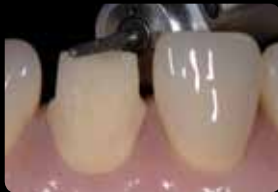
Cut-back du bord incisal